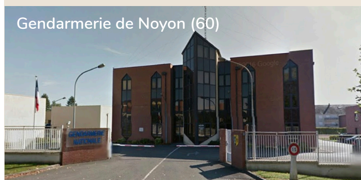
Gendarmerie de Noyon (60)