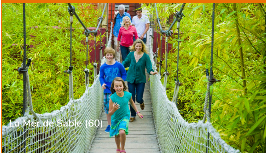
La Mer de Sable (60)