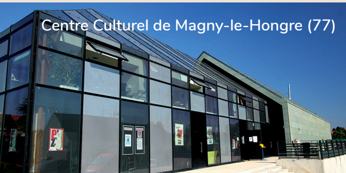
Centre Culturel de Magny-le-Hongre (77)