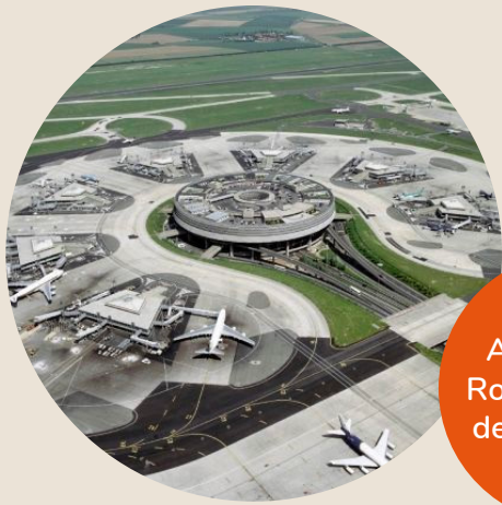
Aéroport de Roissy Charles de Gaulle (95)